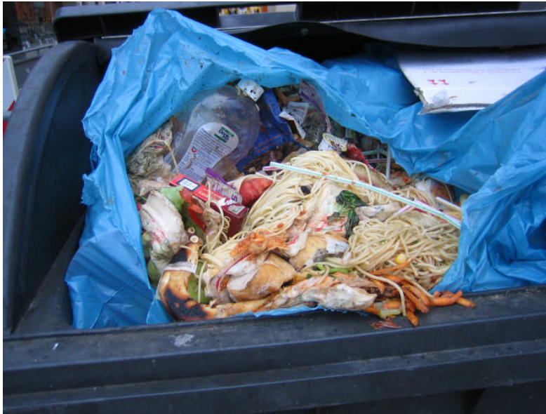
Speiseresteentsorgung einer Pizzeria über die Restmülltonne

Verschmutzung der Fußgängerzone mit „Speisebrühe“ während der Leerung