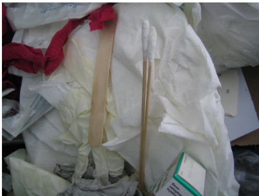
...Spatel und Watteträger..