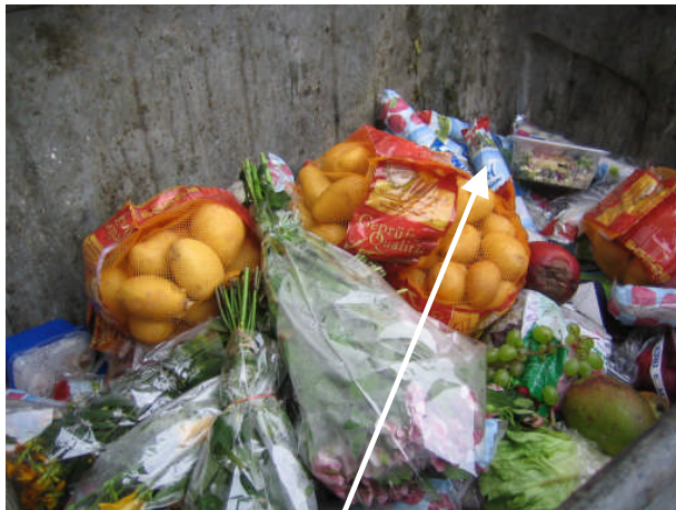
Abgepackte Salami ca. 20 Stück a 1kg im Restmüll eines Supermarktes

Entsorgung (abgepackter) Bioabfälle und abgelaufener Lebensmittel über die Restmülltonne